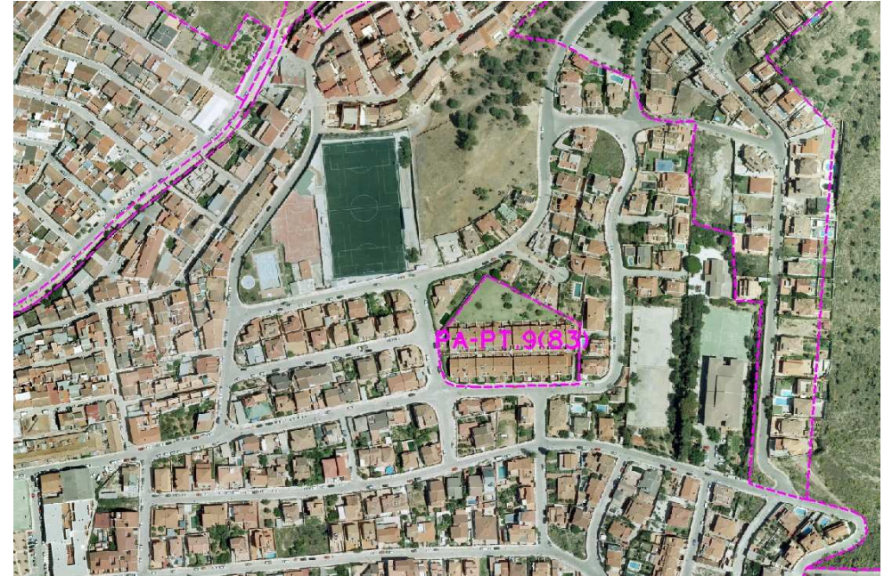
Ordenación Pormenorizada Completa